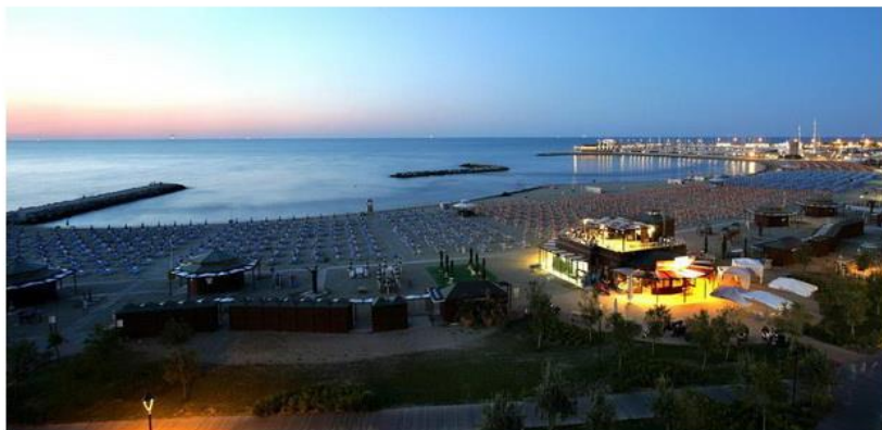
Пляжи Сан Джулиано San Giuliano

У Марелло широкие и очень ухоженные пляжи. Здесь проводятся различные праздники, проходят фестивали, танцевальные шоу и спортивные состязания по пляжному волейболу и мини-футболу. Также, на пляжах бывают дегустации местных вин.